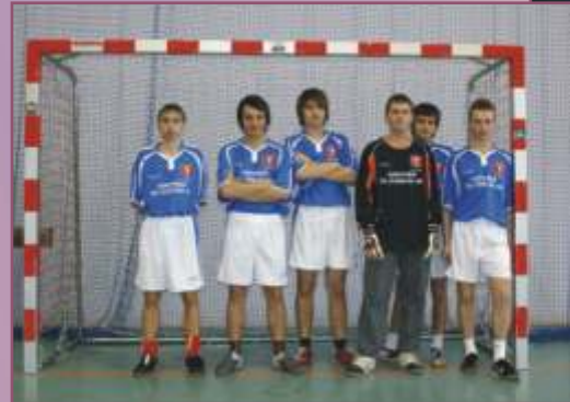
Drużyny ze Szczepanowa: lektorzy (po lewej), ministranci (po prawej)

I Zimowy Turniej Tenisa Stołowego. Każdy dzień zawodów sportowych rozpoczynał się liturgią słowa Bożego w kościele. W halowym turnieju piłki nożnej wzięło udział 46 drużyn: ministranckich, lektorskich i szkolnych z dekanatu Brzesko oraz okolic. W sumie uczestniczyło w turnieju 350 chłopców. Halowy