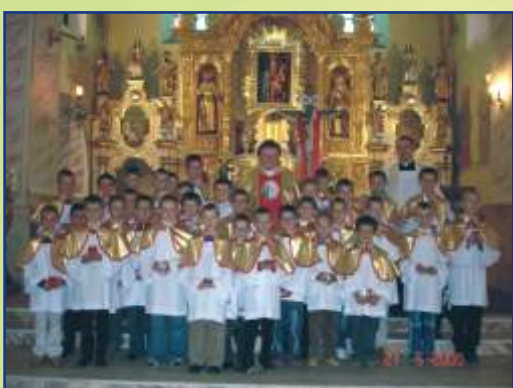
Nowi ministranci z parafii Łącko

W niedzielę 21 maja 2006 r. w parafii św. Jana Chrzyciela w Łącku do grona ministrantów zostało przyjętych 34 chłopców (chyba rekordowa ilość). Po czym grupa służby liturgicznej udała się na szczyt zwany Cebulówką, by razem z mieszkańcami podczas Mszy św. przy kapliczce prosić o urodzaje i błogosławieństwo w rodzinach. Cała uroczystość zakończyła się agapą z ogniskiem.