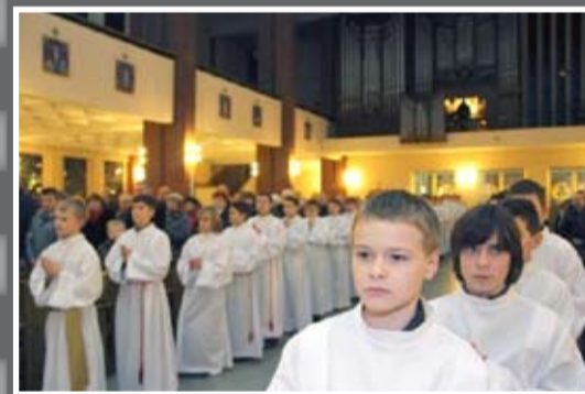
Lektorzy (Dek. Mielec – Południe)