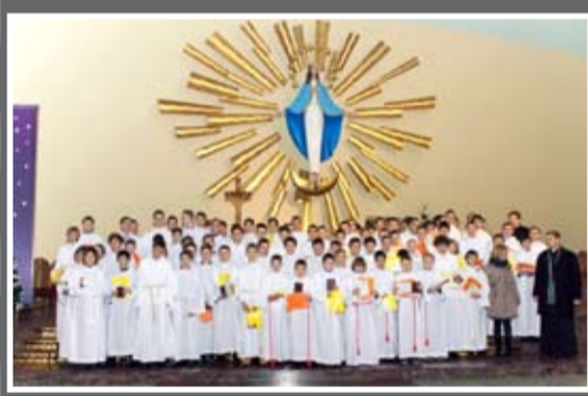
Lektorzy (Dek. Nowy Sącz – Wschód)