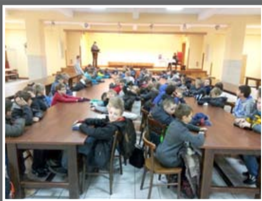
Brzesko – św. Jakuba