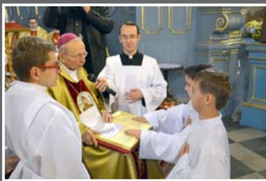
Lektorzy (Dek. Tarnów – Północ)

Kursy lektorskie. W roku 2013-2014 odbyły się kursy lektorskie w dekanatach: Brzesko (53), Grybów (70), Mielec – Południe (80), Mielec – Północ (70), Nowy Sącz – Centrum (82), Nowy Sącz – Wschód (80), Pustków – Osiedle (70), Tarnów – Katedra (70), Tarnów – Północ (49).